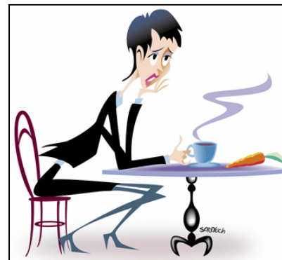
Clásica chica que esta a dieta en el café Tomas de la 10?

Pero no me malentiendan, las dietas son necesarias, pero el propósito de una dieta es para perder peso de manera sana y controlada, y debe ser proporcionada por alguien calificado. Recuerda debe ser especial para ti, atendiendo tus problemas específicos (no siguiendo la dieta de la revista “Bodas: para mujeres como tú”), y una vez que estés en tú peso ideal, deberías aprender a comer bien y llevar una