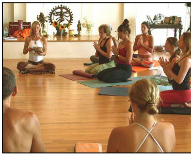
Esta clase de Yoga se ve muy ¡intensa!